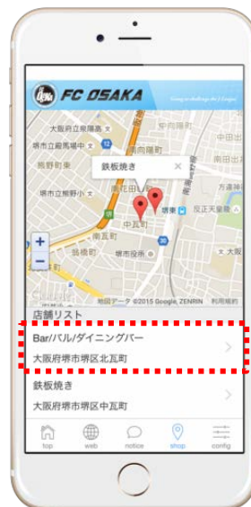
協力店の店舗リスト一覧を 確認できます。