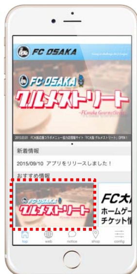
FC 大阪応援コラボメニュー 協力店ポータルサイトの トップ画面