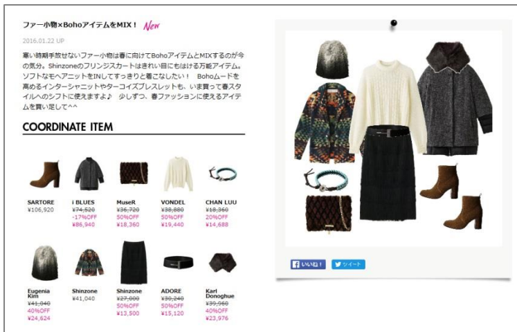
ELLE SHOP「リッチコーデ」コンテンツ

リッチコーデは、一般リリースに先行して既に株式会社ハースト婦人画報社が運営するオンラインセレクトショップ「雑誌『エル(ELLE)』公式ファッション通販エル・ショップ: http://elleshop.jp/ 」で採用されており、使い勝手、訴求力両方において好評をいただいています。