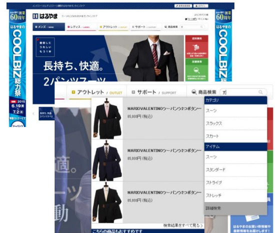
はるやまオンラインストアリッチサジェスト画面