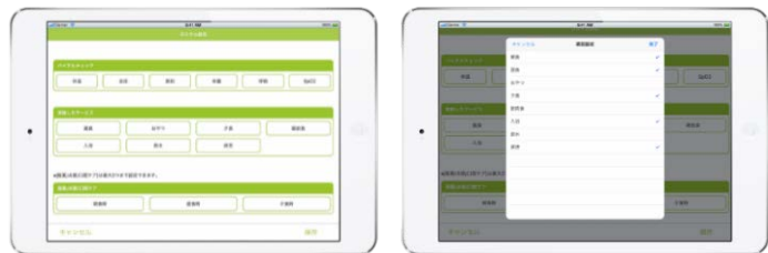
※上図は画面イメージです

また、「呼吸」「SpO2（酸素飽和度）」といった項目も追加可能になり、事業所ごとに表示する項目をカスタマイズすることで、さまざまなサービス事業形態に合わせた連絡帳の出力が可能になりました。